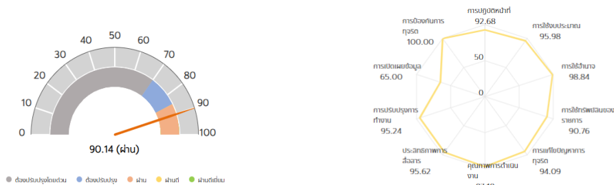
กราฟแสดงผลการประเมินคุณธรรมและความโปร่งใสในการดำเนินงานของหน่วยงานภาครัฐ ประจำปีงบประมาณ พ.ศ. ๒๕๖๘ จังหวัดลำพูน