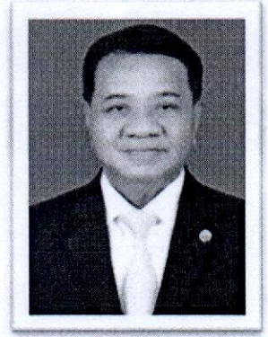
๙.พล.ต.อ.วิเชียร พงษ์โพธิ์ศรี อดีต ผบ.ตร. , อดีตเลขาธิการ สมช. อดีตปลัดกระทรวงคมนาคม