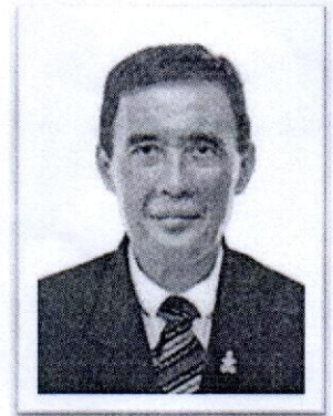
๖.พล.ต.ท.อำนาจ นิมมะโน อดีต ผบช.ภ.๑