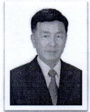
๓.พล.ต.อ.ชัยยง กীরติขจร อดีต รอง ผบ.ตร.