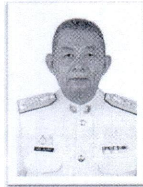
๑๔.พล.ต.ท.เสถียร คุวิบูลย์ศิลป์ อดีตผู้ทรงคุณวุฒิพิเศษ ตร.