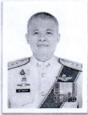
๑.พล.ต.ท.กมล เจริญรักษา อดีตผู้ทรงคุณวุฒิพิเศษ ตร.