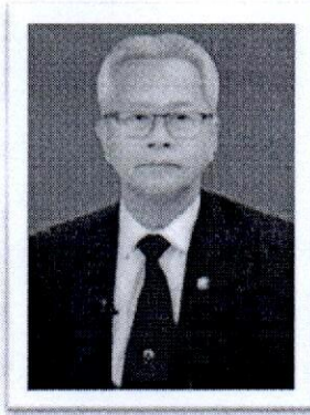
๒.นายธวัชชัย ไทยเขียว อดีตอธิบดีกรมพินิจคุ้มครองเด็กและเยาวชน อดีตรองปลัดกระทรวงยุติธรรม