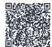
ตราสัญลักษณ์ อพวช.

สำนักบริการกลาง กองกลาง โทรศัพท์ ๐ ๒๕๓๗ ๙๙๙๙ ต่อ ๑๘๕๕ (ประทุม) โทรสาร ๐ ๒๕๓๗ ๙๙๐๐ saraban@nsm.or.th