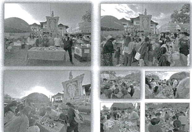
225 หมู่.3 ตำบลเวียงยอง อำเภอเมือง จังหวัดลำพูน E-MAIL : LAMPHUNFISHPRO@GMAIL.COM TEL:053511430