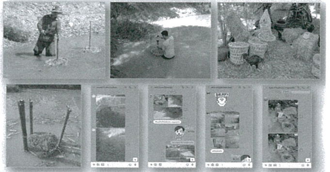
225 หมู่.3 ตำบลเวียงยอง อำเภอเมือง จังหวัดลำพูน E-MAIL : LAMPHUNFISHPRO@GMAIL.COM TEL:053511430