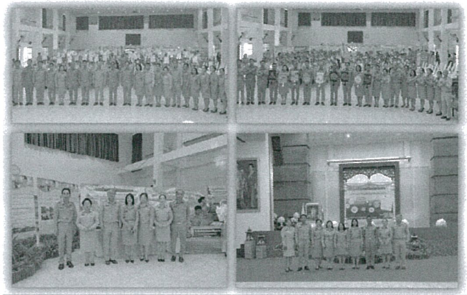
225 หมู่.3 ตำบลเวียงยอง อำเภอเมือง จังหวัดลำพูน E-MAIL : LAMPHUNFISHPRO@GMAIL.COM TEL:053511430