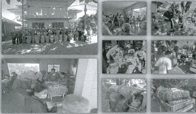
225 หมู่.3 ตำบลเวียงยอง อำเภอเมือง จังหวัดลำพูน E-MAIL : LAMPHUNFISHPRO@GMAIL.COM TEL:053511430