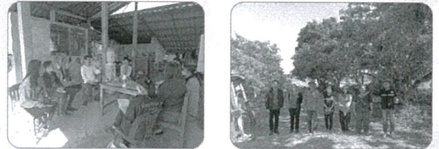
225 หมู่.3 ตำบลเวียงยอง อำเภอเมือง จังหวัดลำพูน E-MAIL : LAMPHUNFISHPRO@GMAIL.COM TEL:053511430