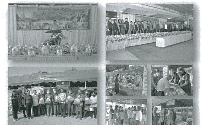
225 หมู่.3 ตำบลเวียงยอง อำเภอเมือง จังหวัดลำพูน E-MAIL : LAMPHUNFISHPRO@GMAIL.COM TEL:053511430