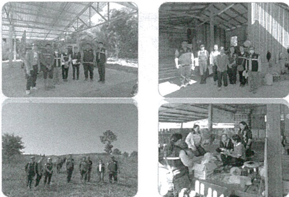
225 หมู่.3 ตำบลเวียงยอง อำเภอเมือง จังหวัดลำพูน E-MAIL : LAMPHUNFISHPRO@GMAIL.COM TEL:053511430