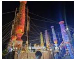
เมืองอัจฉริยะวิถีสรางสรรค์