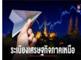
เมืองอุตสาหกรรมสมดุล สร้างสรรค์