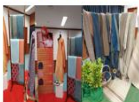
เมืองเศรษฐกิจสร้างสรรค์ บนความพอเพียง