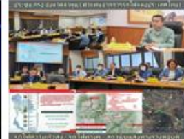
เมืองเกษตรอุตสาหกรรม อัจฉริยะสร้างสรรค์