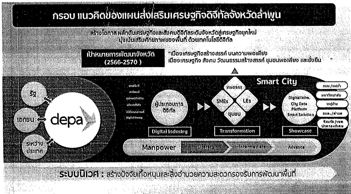
รูปที่ 2-1 กรอบแผนส่งเสริมเศรษฐกิจดิจิทัลจังหวัดลำพูน

โดยการจัดทำแผนส่งเสริมเศรษฐกิจดิจิทัลจังหวัดลำพูน สำนักงานส่งเสริมเศรษฐกิจดิจิทัลจะมุ่งเน้นเสริมศักยภาพของพื้นที่ ตามเป้าหมายการพัฒนาจังหวัด โดยมีรายละเอียดการเชื่อมโยงแผนส่งเสริมเศรษฐกิจดิจิทัลกับแผนพัฒนาจังหวัดลำพูน ดังต่อไปนี้