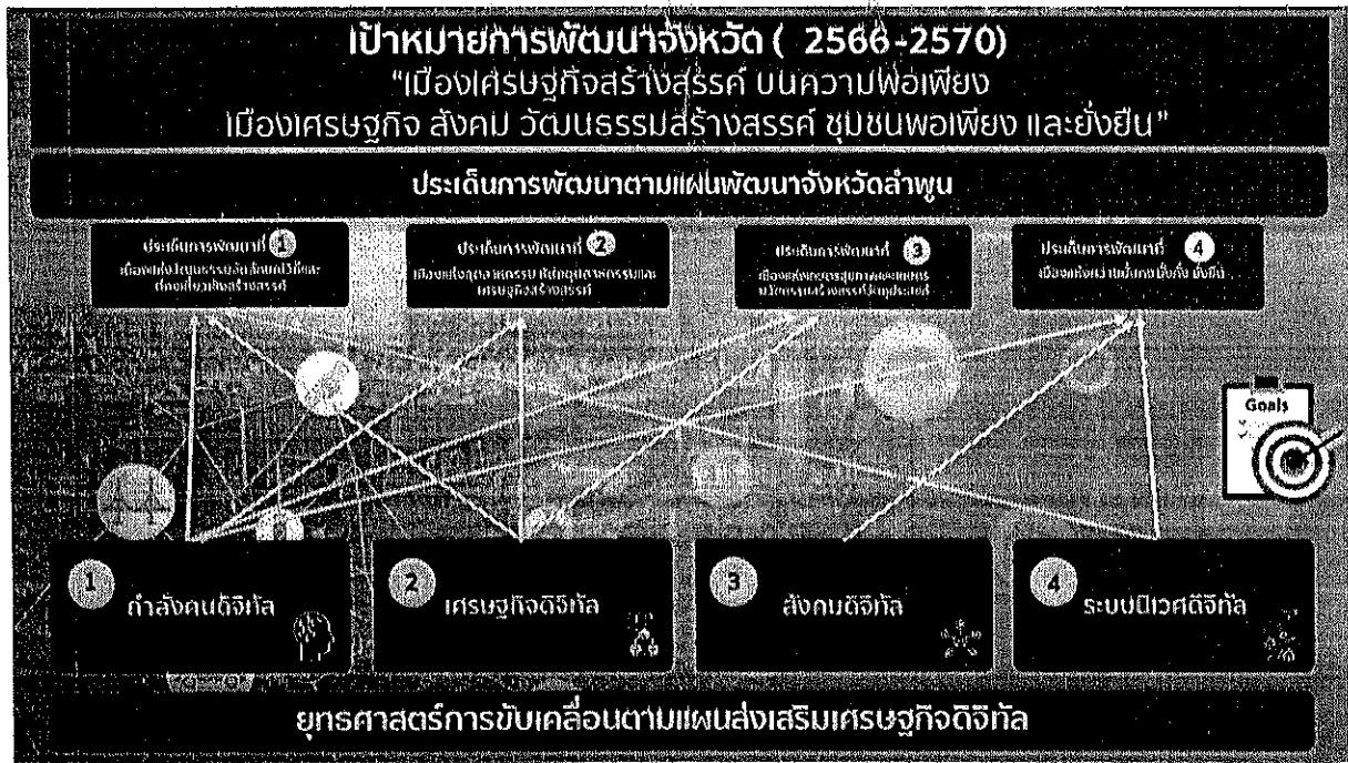
รูปที่ 2-2 การเชื่อมโยงแผนส่งเสริมเศรษฐกิจดิจิทัลกับแผนพัฒนาจังหวัดลำพูน